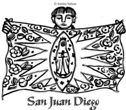
San Juan Diego

~ Fray Gilberto-Glz, OFM, © Copyright, J.S. Paluch Co.