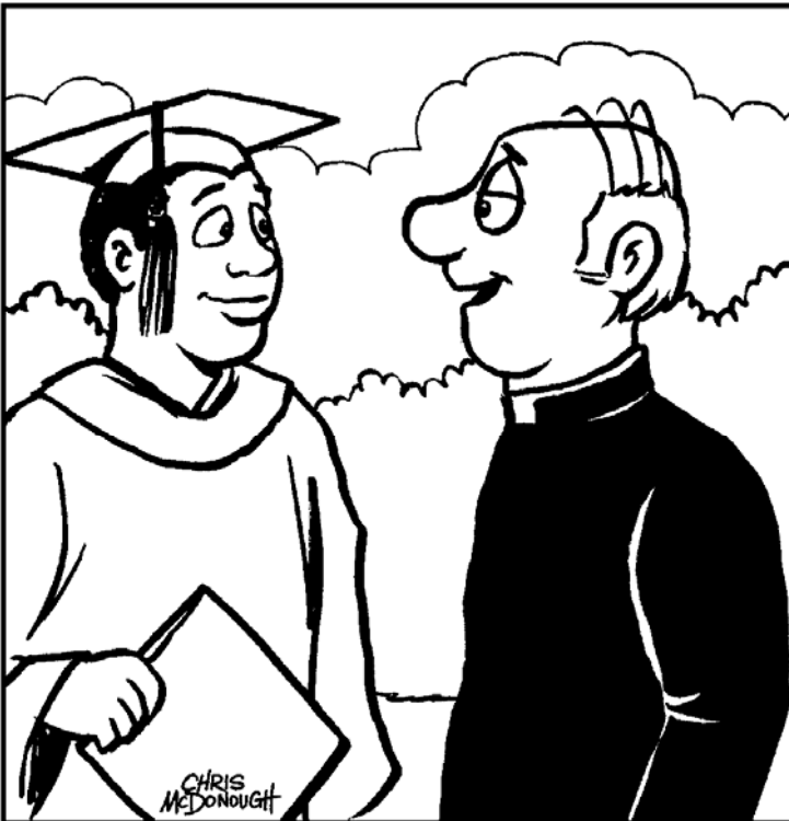
© 2002 World Library Publications, a division of J. S. Paluch Co., Inc.

nueve parroquias sostenidas en la catedral durante advenimiento era un éxito tan enorme con más que docena sacerdotes y personas 200+ allí que estamos ensamblando fuerzas otra vez durante prestado. Nuestro servicio de la reconciliación estará en la catedral del concepto inmaculado el martes, 26 de febrero, en 7:00 P.M. Varios sacerdotes estarán disponibles para asistir a los que hablen español. ¡Venido, sea una parte de esta celebración maravillosa de la misericordia y de la compasión del dios!