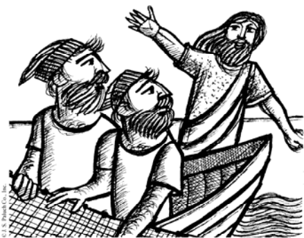
Ellos dejaron las redes y lo siguieron