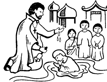
San Francisco Javier