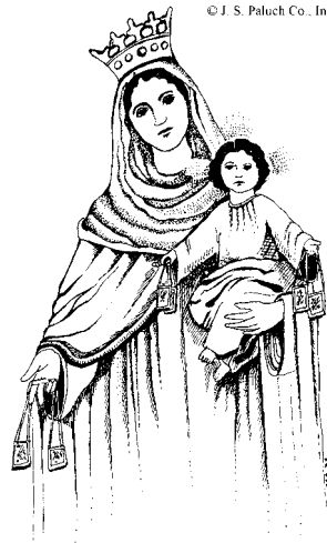
Nuestra Señora del Carmen