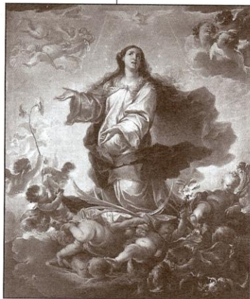
Immaculate Conception, 1682, by Francisco de Solís.

O n December 8, Catholics celebrate the Solemnity of the Immaculate Conception, who is also the patroness of the United States. This belief, defined by Pope Pius IX in 1854, teaches us that the Virgin Mary was preserved not only from the stain of original sin, but that in preparation for bearing