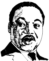
Martin Luther King, Jr.