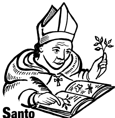
Santo ALBERTO MAGNO